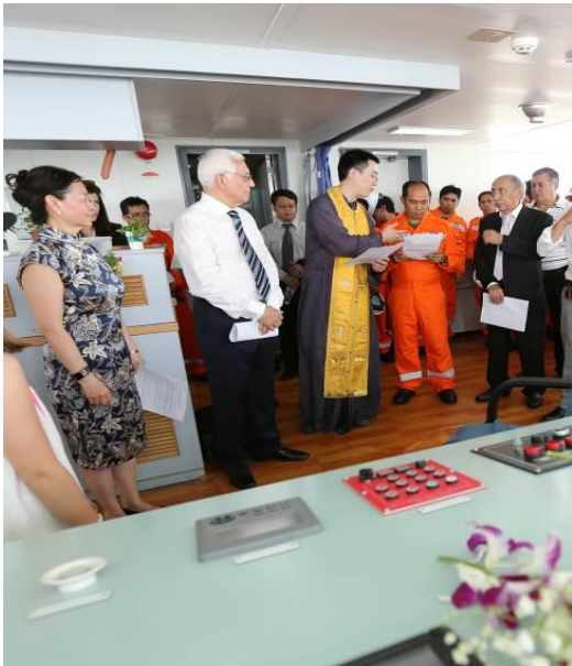
Στιγμιότυπο από τον αγιασμό στην γέφυρα.

Ακολούθησε ο αγιασμός στην γέφυρα του πλοίου από Ορθόδοξο ιερέα και γεύμα, το οποίο παρέθεσε η Sinopacific προς τιμήν όλων των προσκεκλημένων.