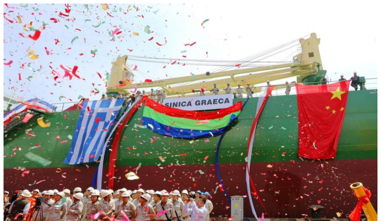
Το όνομα του πλοίου αποκαλύπτεται.

Ο Πρόεδρος της Sinopacific τόνισε ότι η εταιρεία τους δίνει σημασία στην λεπτομέρεια και είναι υπερήφανος, διότι το "Sinica Graeca" αποτελεί παράδειγμα του τι μπορούν να επιτύχουν οι άνθρωποι, οι οποίοι επιθυμούν να κάνουν σημαντικά πράγματα εργαζόμενοι με σεβασμό στην διαφορετικότητά τους, συνεργαζόμενοι με επαγγελματισμό και θετικό πνεύμα.