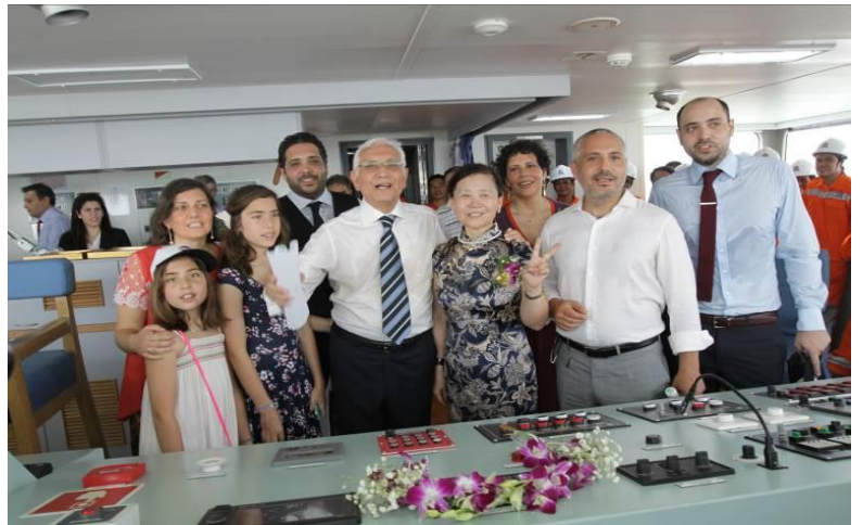
Μέλη της οικογένειας Αγγελάκου με την ανάδοχο στην γέφυρα.

Ακολούθησε ο αγιασμός στην γέφυρα του πλοίου από Ορθόδοξο ιερέα και γεύμα, το οποίο παρέθεσε η Sinopacific προς τιμήν όλων των προσκεκλημένων.