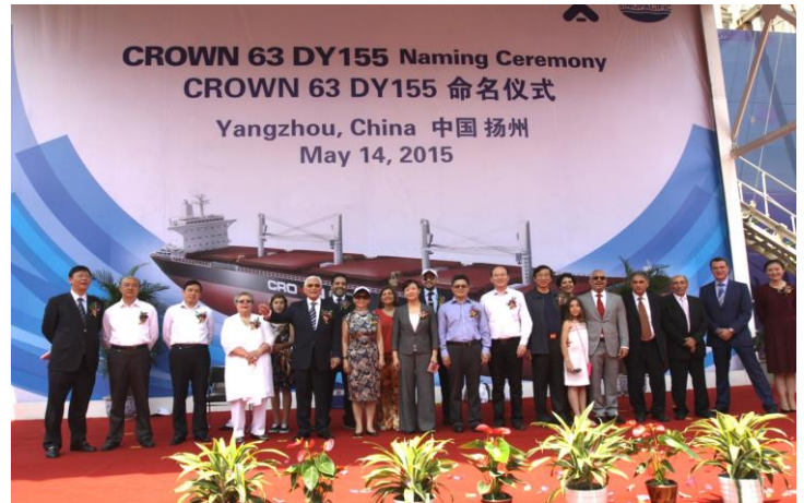
Στιγμιότυπο από την τελετή.

Την Πέμπτη, 14 Μαΐου 2015 πραγματοποιήθηκε η τελετή ονοματοδοσίας του νεότευκτου Ultramax Bulk Carrier "Sinica Graeca", 63.270 dwt, στα ναυπηγεία Dayang, του ομίλου Sinopacific Shipbuilding Group Co. Ltd. Η κατασκευή έγινε υπό την επίβλεψη του Lloyd's Register of Shipping και τελεί υπό την διαχείριση της Angelakos (Hellas) S.A.